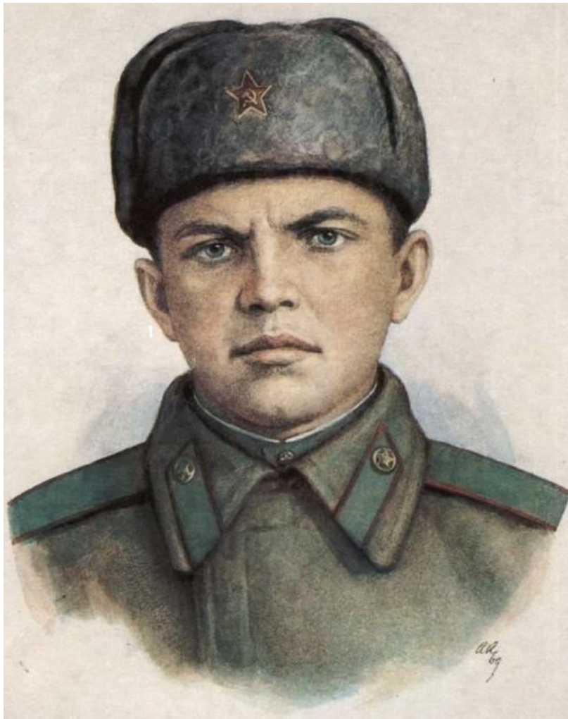
Александр Матросов (1924-1943)

Стрелок-автоматчик 2-го отдельного батальона 91-й отдельной Сибирской добровольческой бригады имени Сталина.