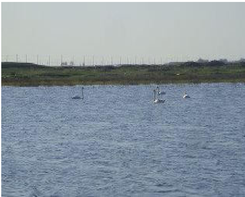
Фото 9 Пруд за селом Камышки облюбовала стая лебедей