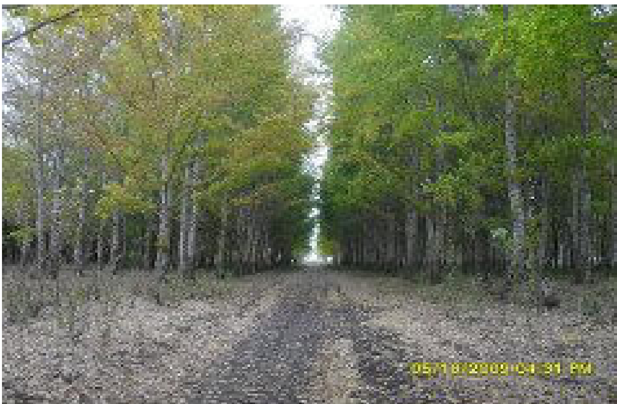
Фото 8 Аллея тополей в парке села