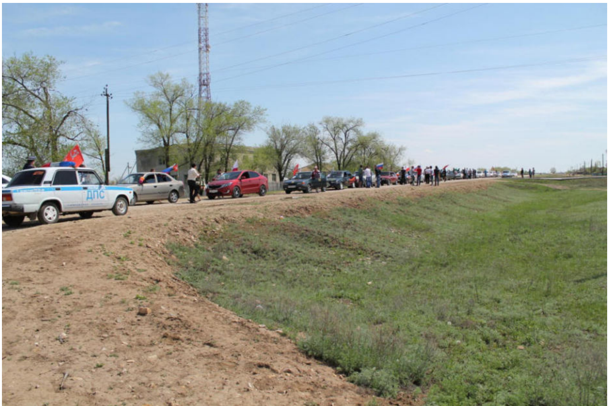
Фото17 Колонна автопробега