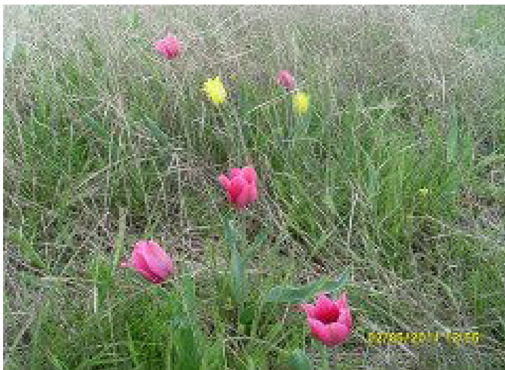
Фото10 Весной вся степь за селом покрывается нежными тюльпанами.