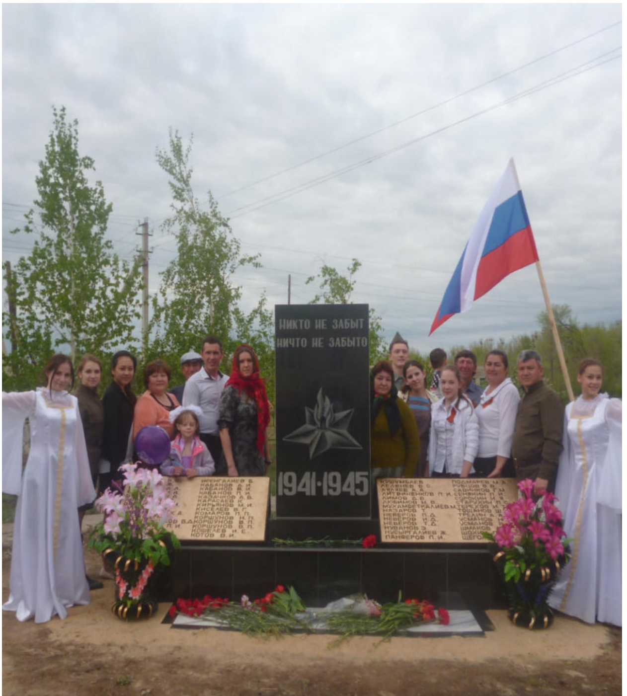
Участники праздничного концерта дню Победы