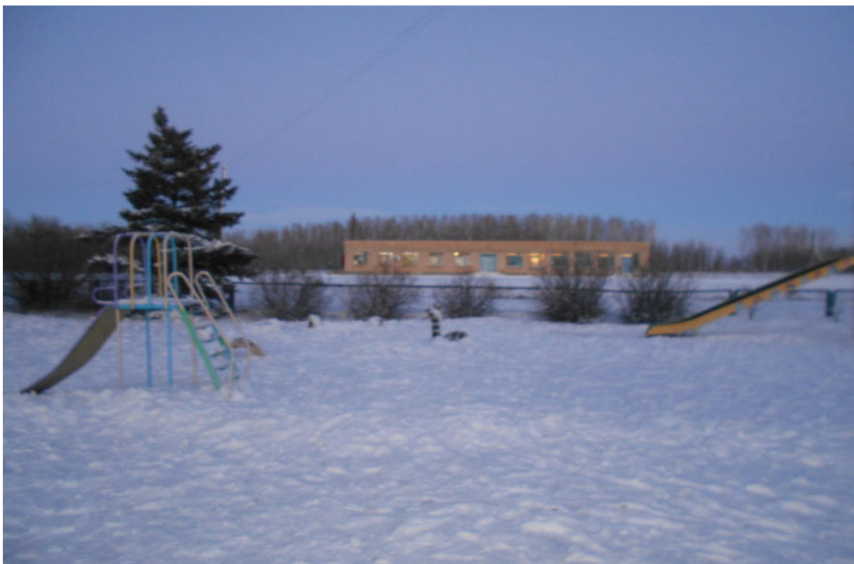
Фото 7 Здание столовой и магазин.