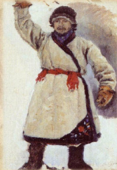
Суриков В.И. «Крестьяне»