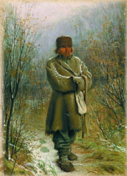
Крамской И.Н. «Созерцатель»