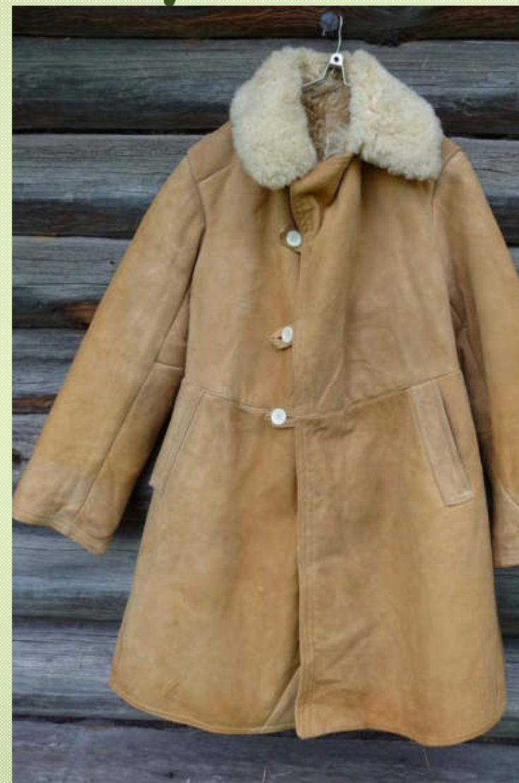
Бекеша советского периода