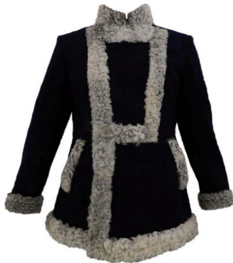
Так выглядела бекеша в XIX веке

Бекеша прошла долгий путь и стала официальной военной формой одежды Российской Императорской армии, а спустя некоторое время - и в войсках СССР. Название «бекеша» применялось и к офицерским коротким полушубкам во время Великой Отечественной Войны 1941-1945 годов..