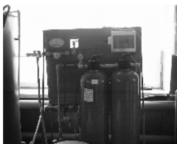
очистка питьевой воды,

От него на 1 сентября школе были вручены ценные подарки : телевизор , видекамера , видеомэгнитофон, спутниковая система , позволяющая принимать 11 телевизионных каналов . Все это , несомненно , поможет школе в наши трудные времена . Несмотря на трудности администрация школы прилагает усилия для того , чтобы учащимся и работникам школы было комфортно , а образовательный процесс проходил на высоком уровне . В частности налажены :