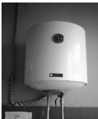
подогрев воды в столовой для мытья посуды, для мытья полов,