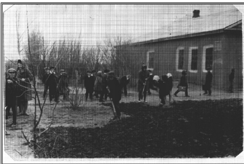
Первая восьмилетняя школа в с.Камышки

хуторов , жили в интернате , который стоял неподалеку. Обучение происходило в 2 смены. Росло село и скоро эта школа стала мала . Она закрывается в 1974 году.