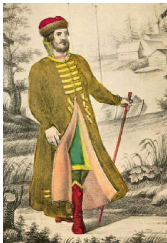
Мужской древнерусский сарафан