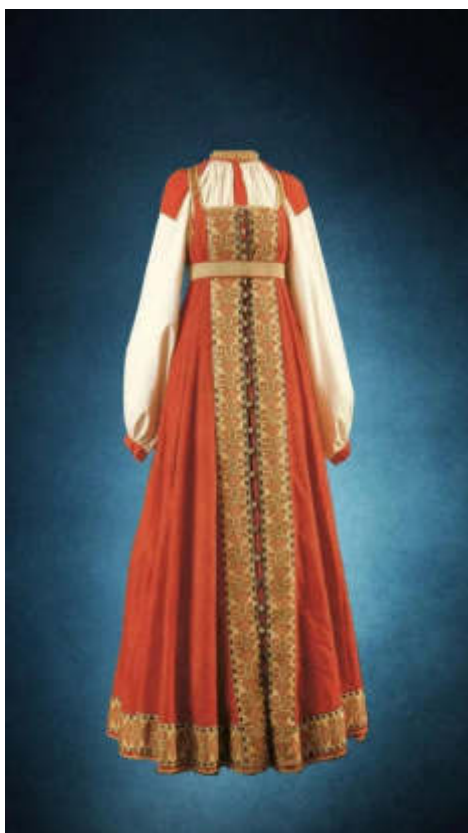
Тюркский женский сарафан

В этимологическом словаре Шанского, указано, что слово сарафан было заимствовано из тюркского языка, где sarapa < перс. serāgā означает «почетная одежда». В древнерусском языке сарафанъ — «мужской кафтан». Ср. жупан и юбка, блуза.