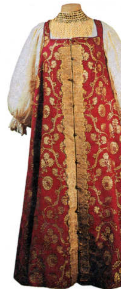
Женский древнерусский сарафан