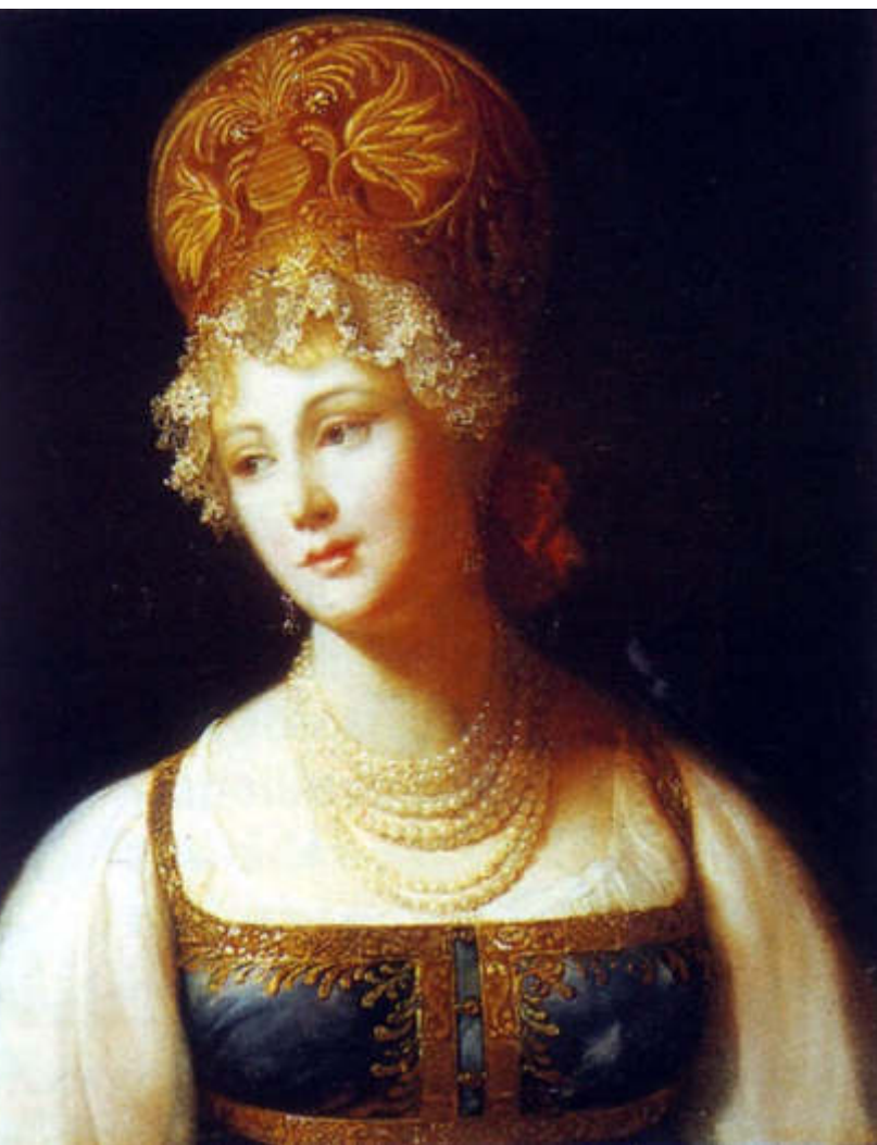
П. Барбье. Портрет молодой женщины в русском сарафане, 1817