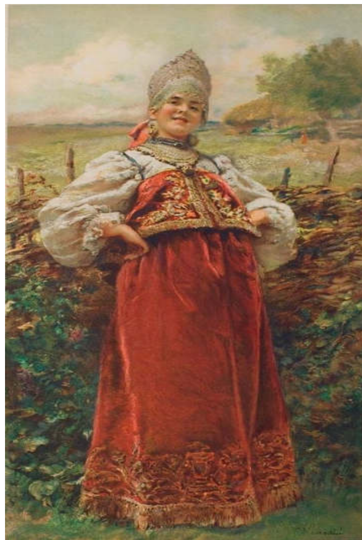
К. Маковский. «У околицы», 1885