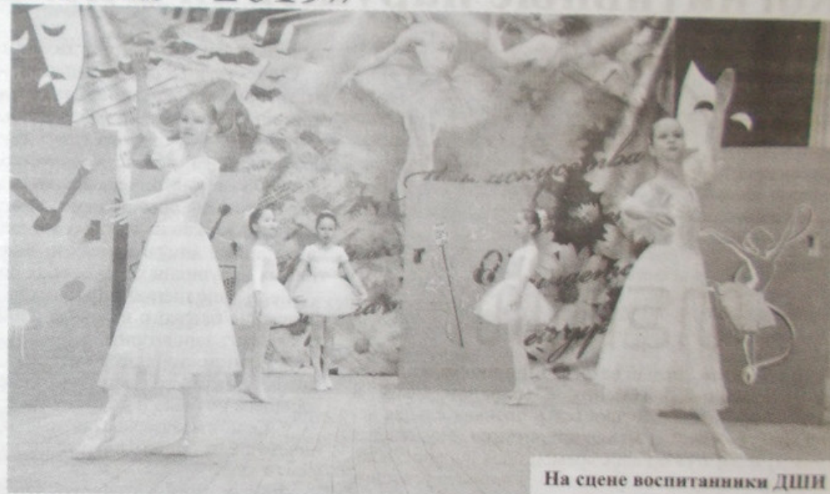
На сцене воспитанники ДШИ

Лучшей литературно-музыкальной композицией фестиваля была названа работа, представленная ДШИ. Здесь было органично все: декорации, костюмы, игра