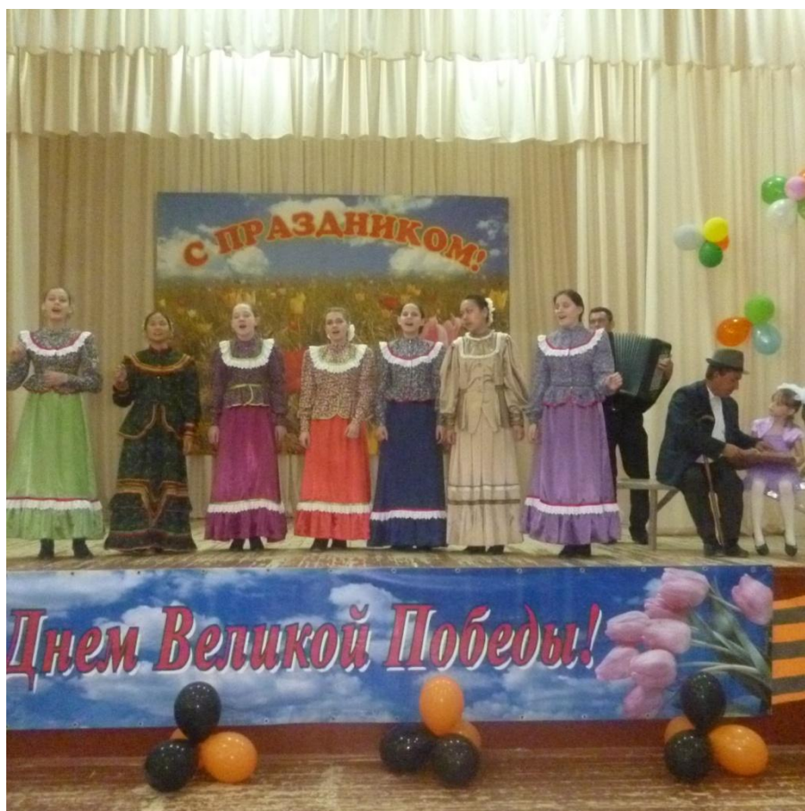
Концерт Дню Победы